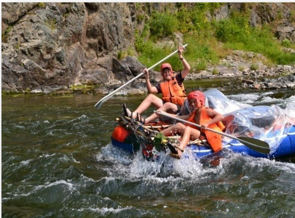
Рис. 3. А нам не страшен... г.к. 55^{\circ}13'26'' с.ш. 86^{\circ}25' в.д.