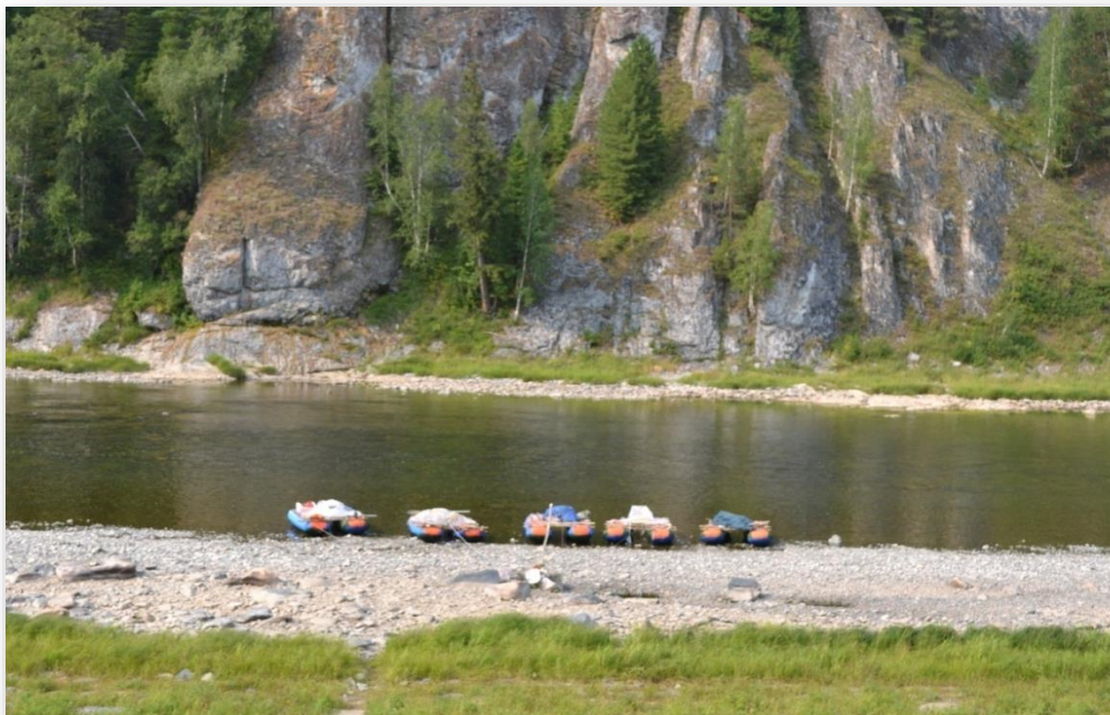
Рис.2 Райский уголок . г.к. 56^{\circ}01'43'' с.ш. 86^{\circ}25' в.д.