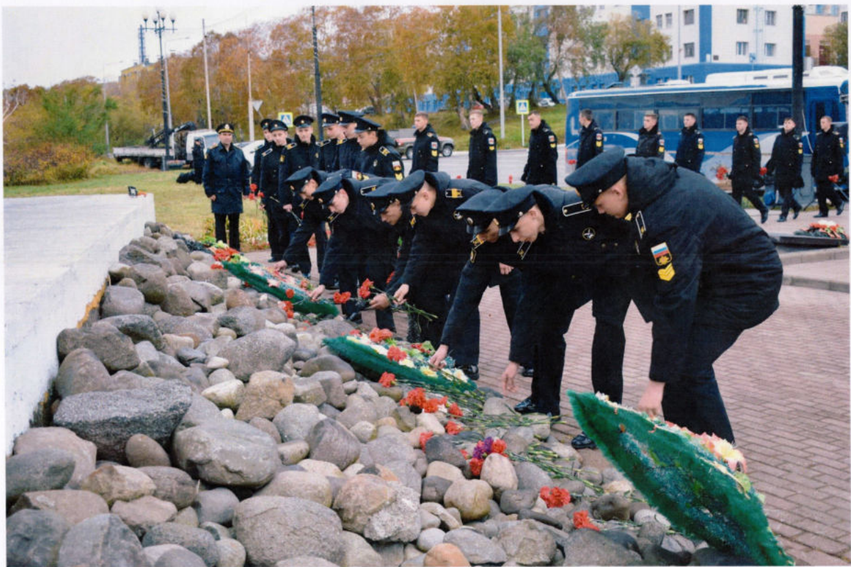
Отдание почестей подводникам у мемориала «Л-16»