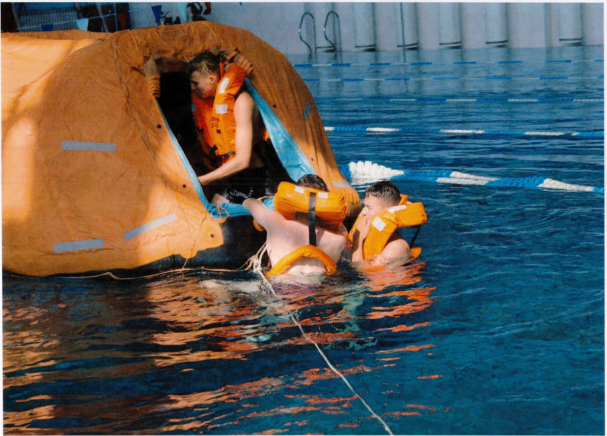
Тренировка с коллективными средствами спасания в ТОВВМУ