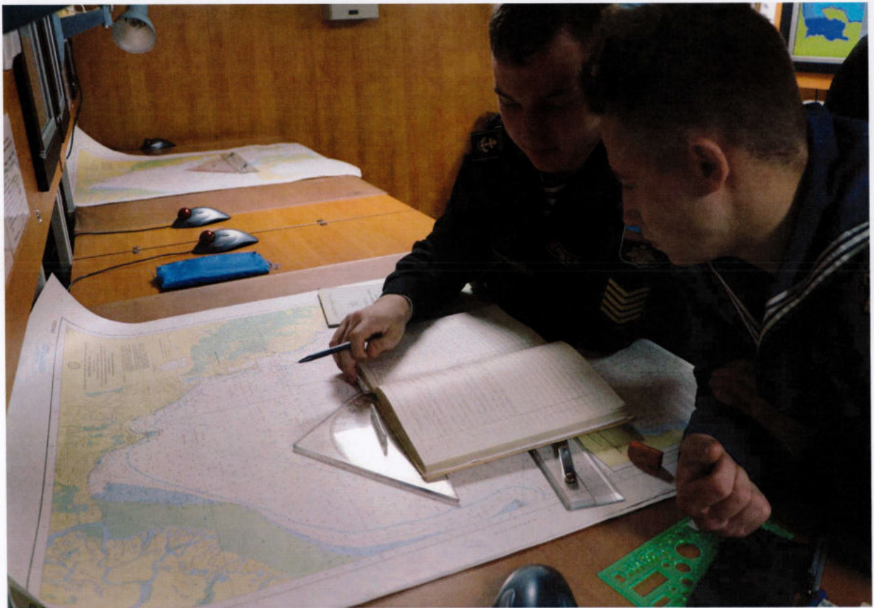
Учимся вести навигационный журнал