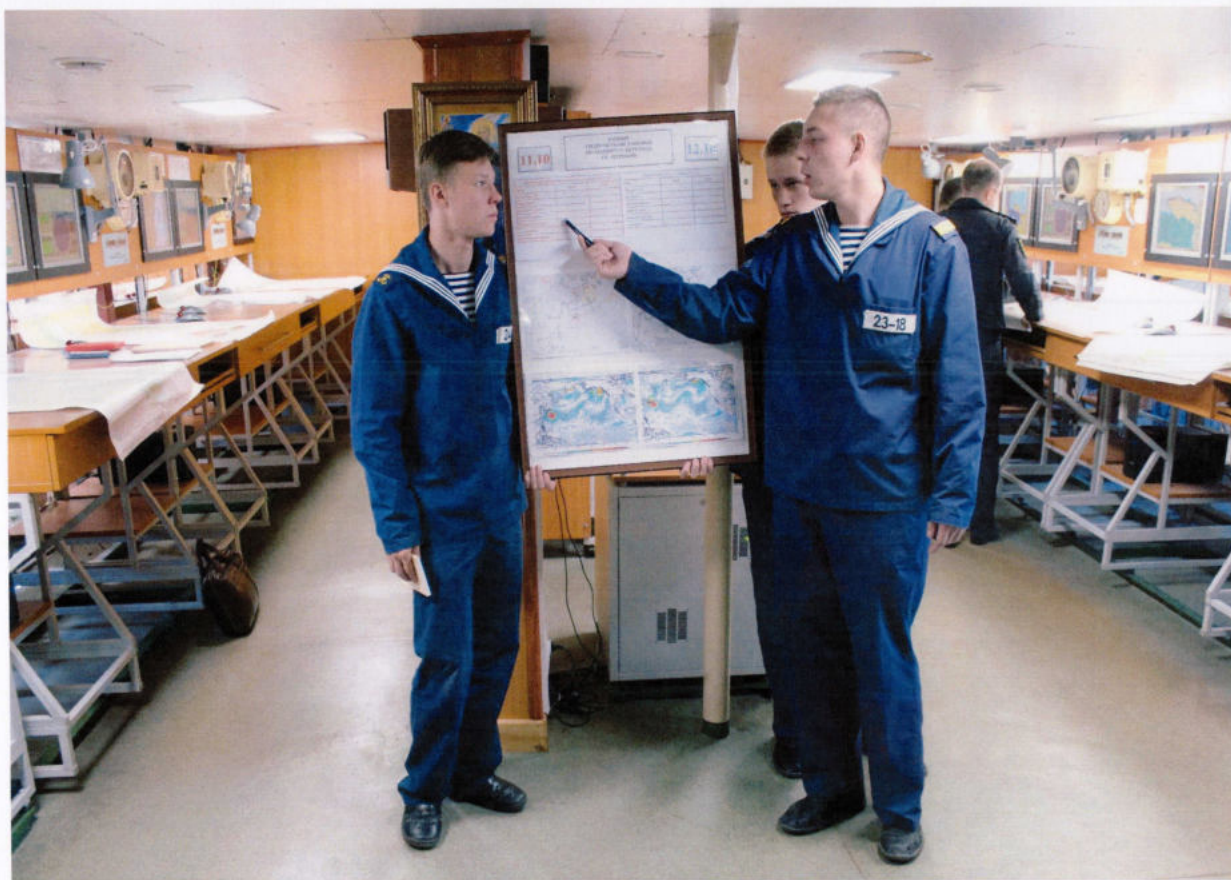
Отрабатываются действия дежурного гидрометеоролога