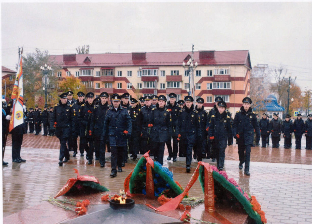
Торжественные мероприятия в Южно-Сахалинске