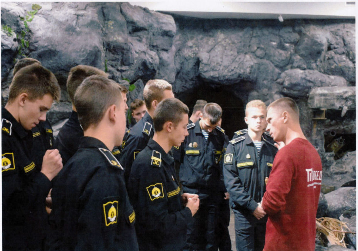
Перед нахимовцами – история освобождения Сахалина...