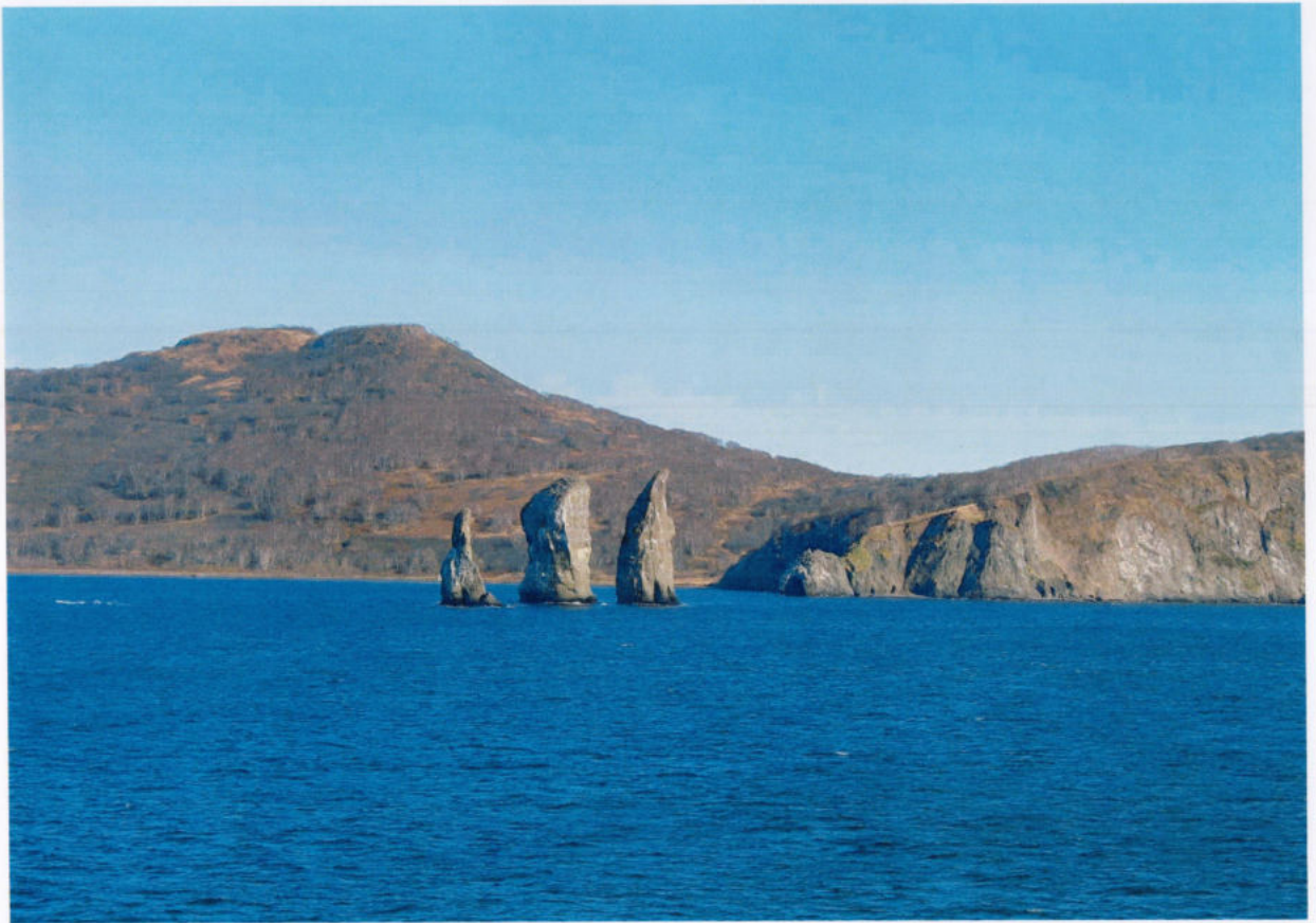
Суровая красота родной земли...