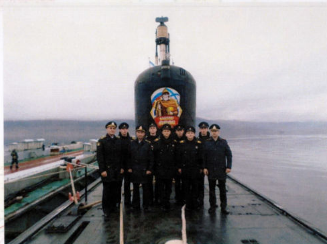
Посещение новейших подводных крейсеров

боевой славы Тихоокеанского флота, довелось нахимовцам увидеть даже подводные лодки нового поколения, которые теперь пополняют ракетно-ядерный щит страны на северо-востоке, в городе славы советских и российских подводников - Вилучинске.