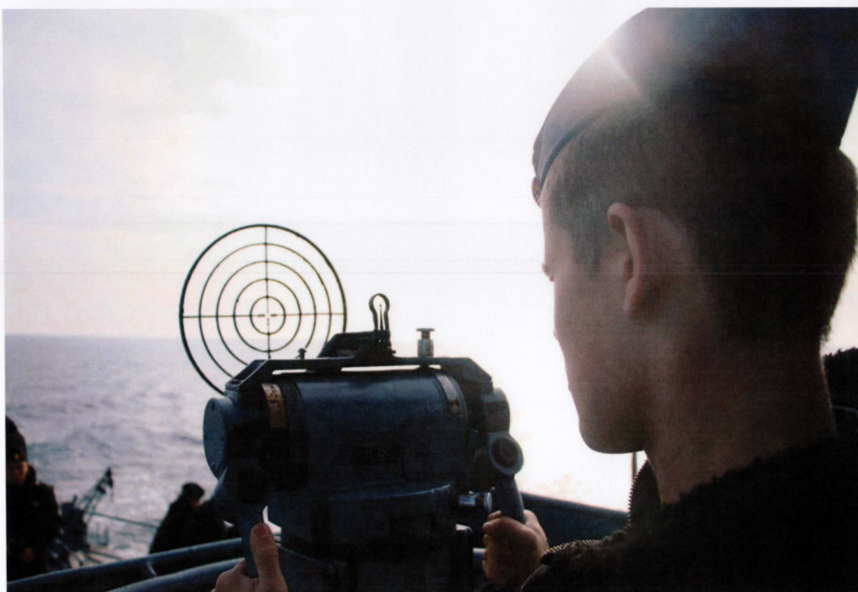
Занятие по корабельному оружию