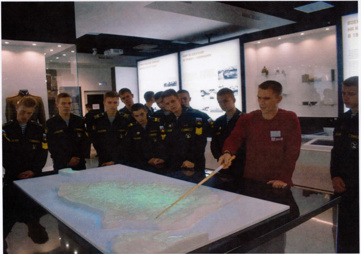
На занятии в историческом парке «Победа»