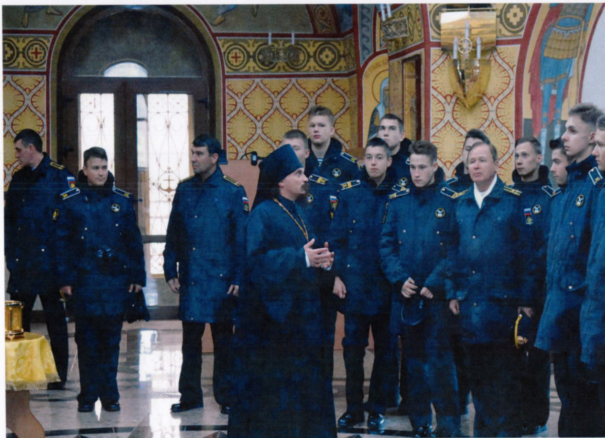
В Морском соборе Петропавловска-Камчатского