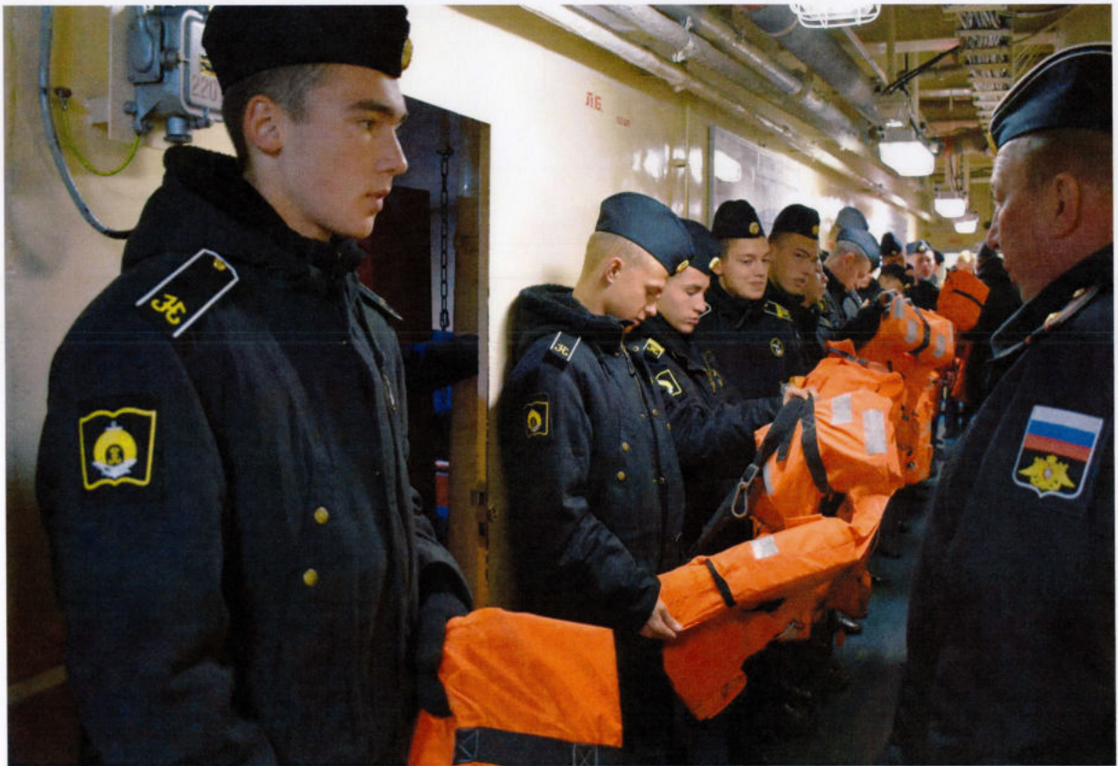
Готовимся к участию в корабельном боевом учении