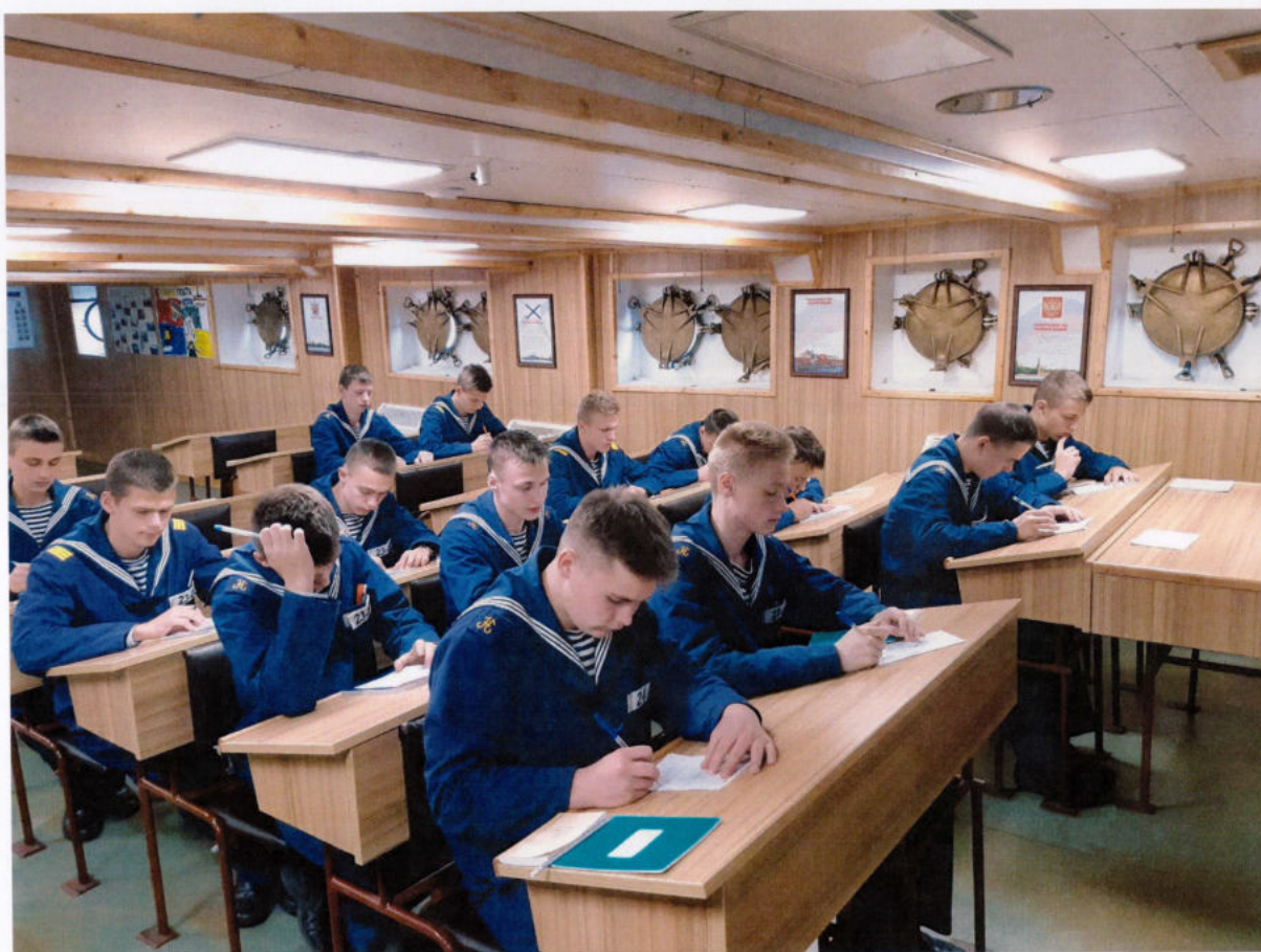
Нахимовцы сдают зачет на допуск к несению ходовой вахты