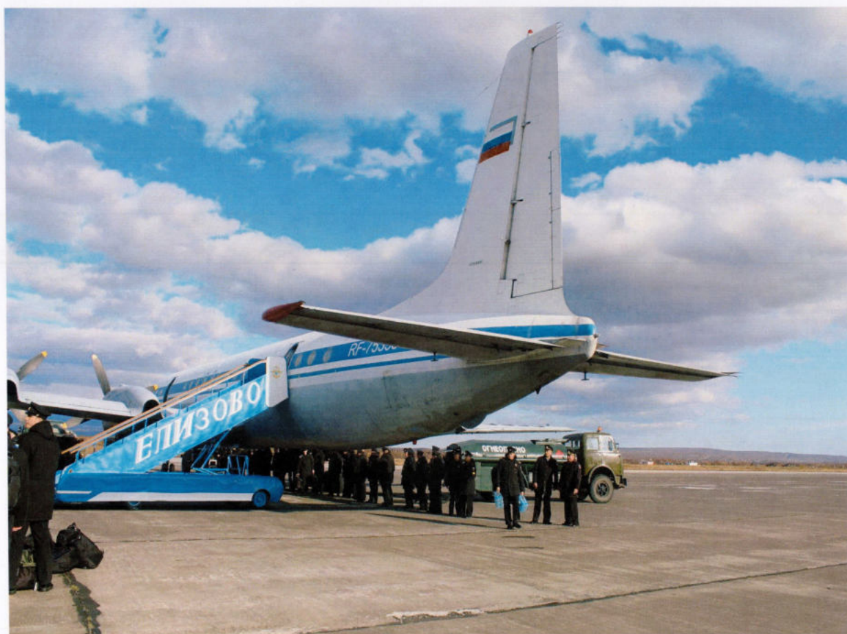
Нас встречает Камчатка...