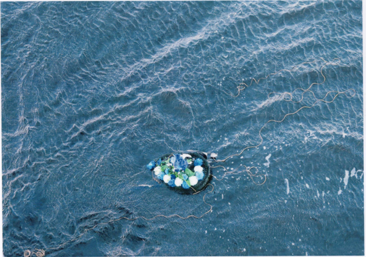
Точка на карте....