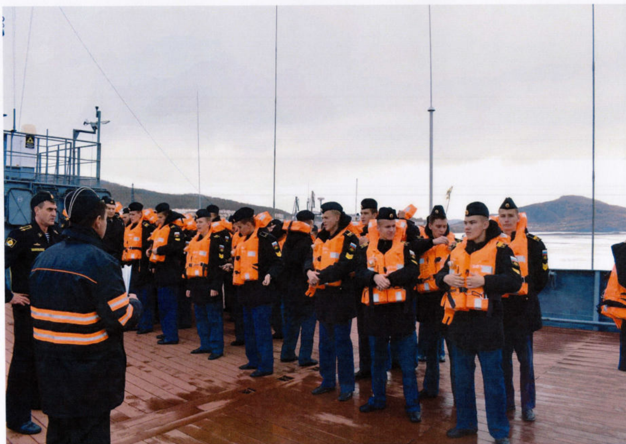
Отрабатываем действия по покиданию корабля