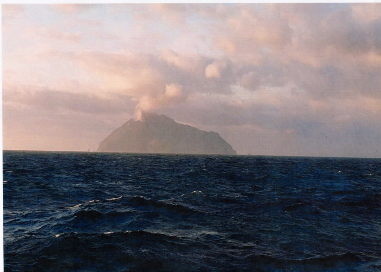
На траверзе – Курилы!