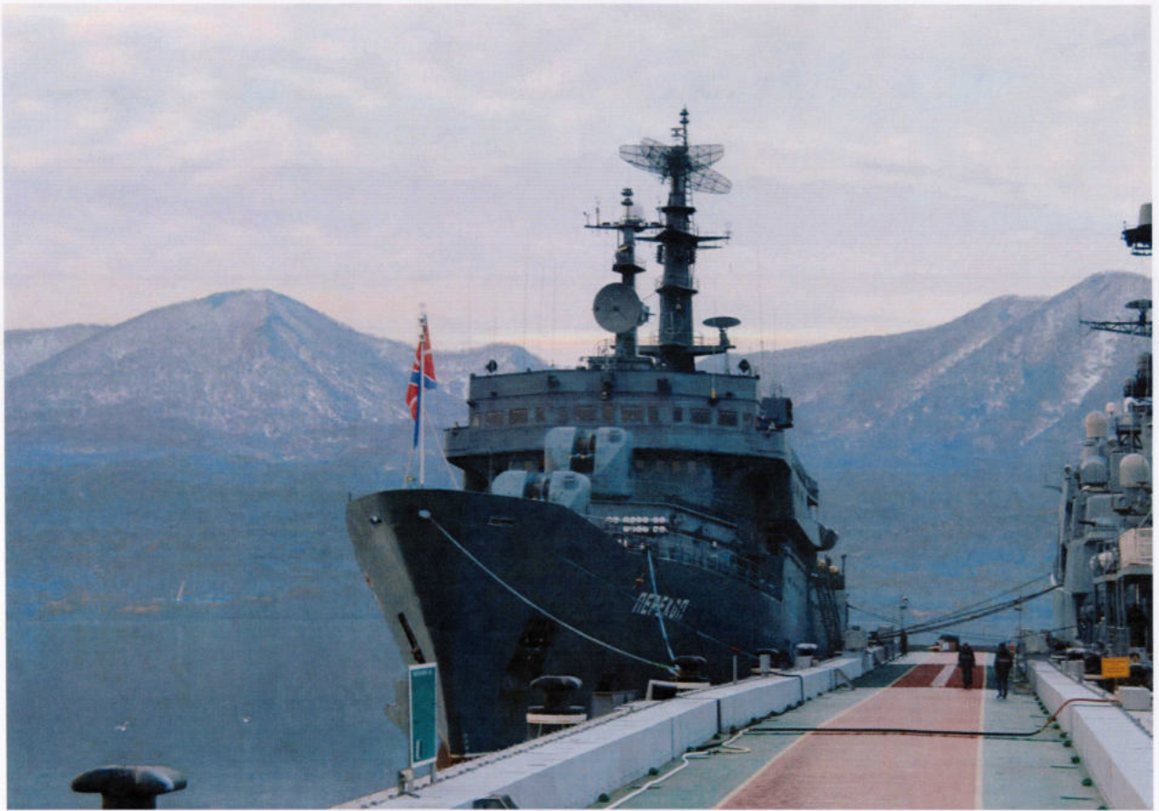
Встречаем «Пересвет» на Камчатской земле