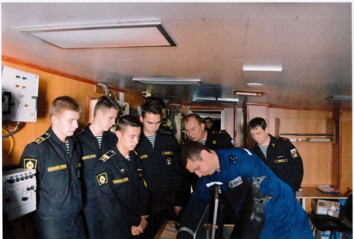
Занятие проводят корабельные специалисты