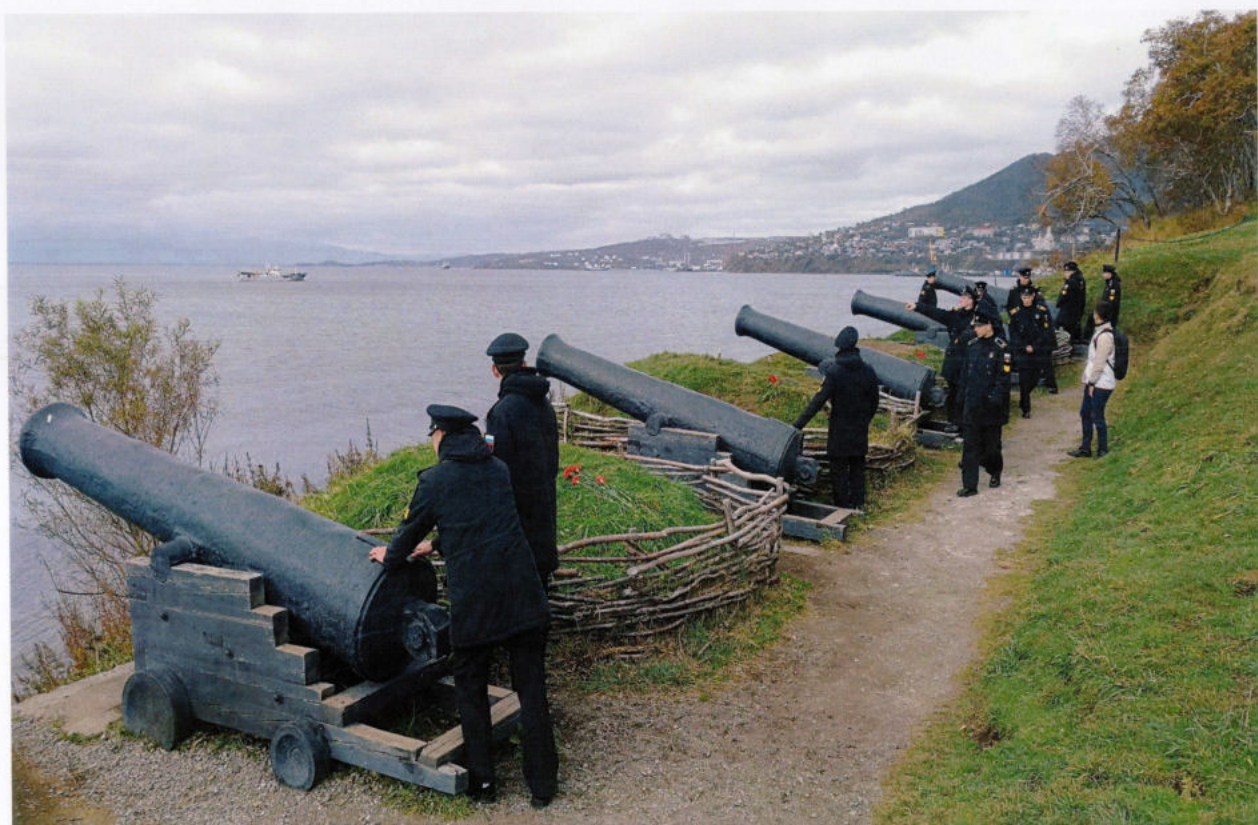
Здесь сражались герои обороны Петропавловска