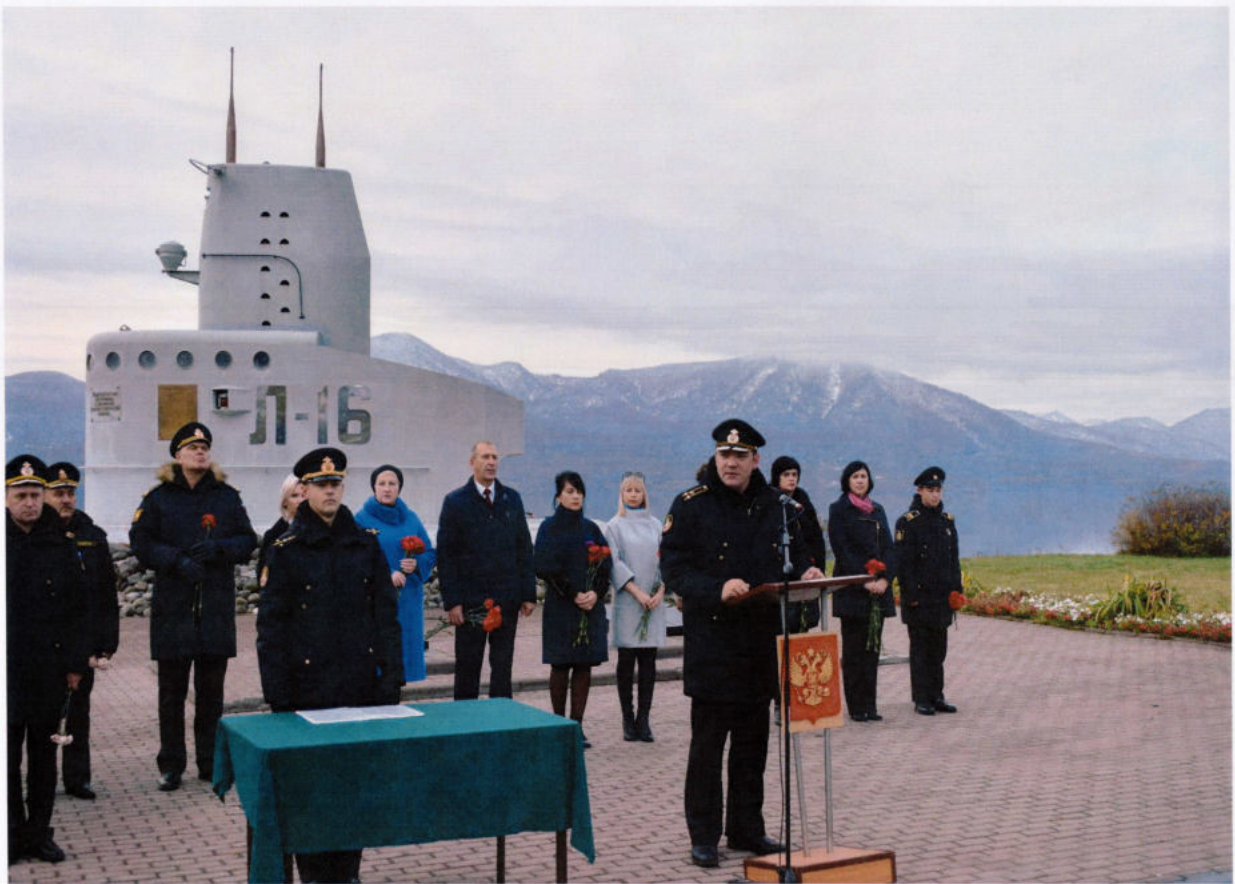
Участие в торжественном мероприятии совместно с командованием Подводных сил