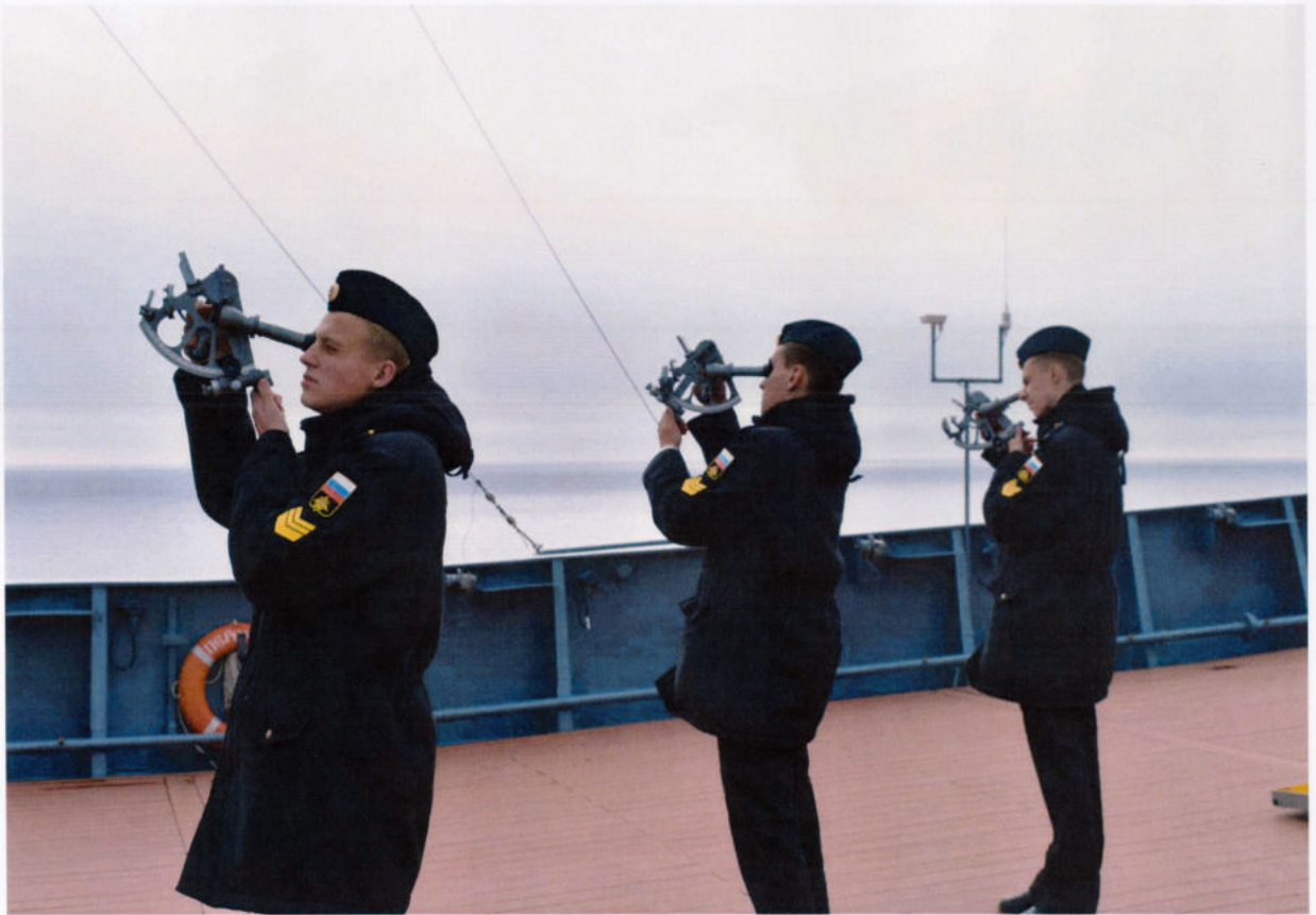
Знакомство с секстаном