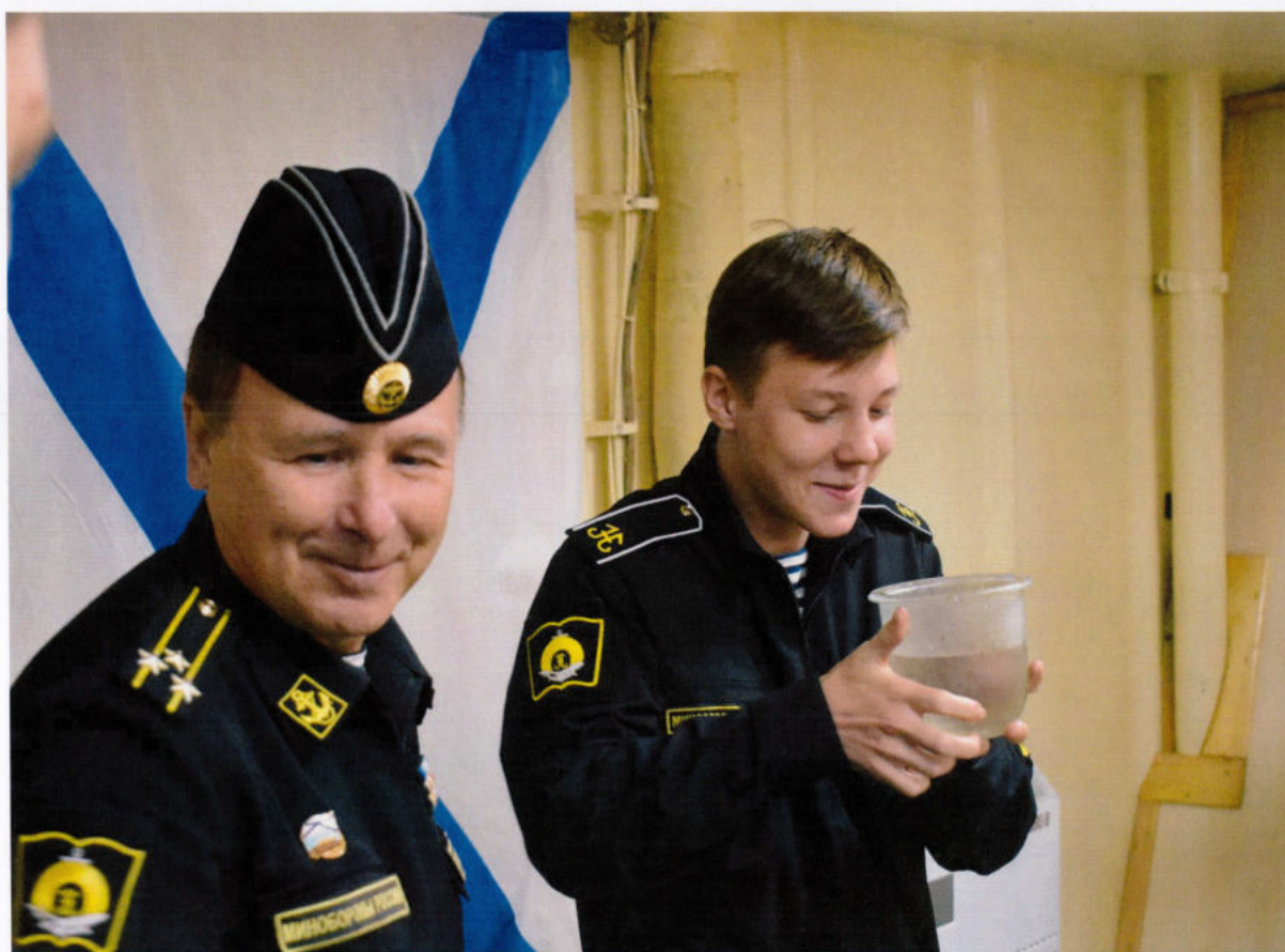
Приятие в морское братство – давний ритуал...