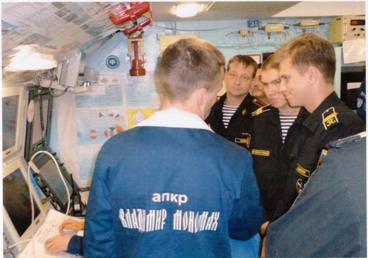
На показательной тренировке ГКП-БИП-штурман