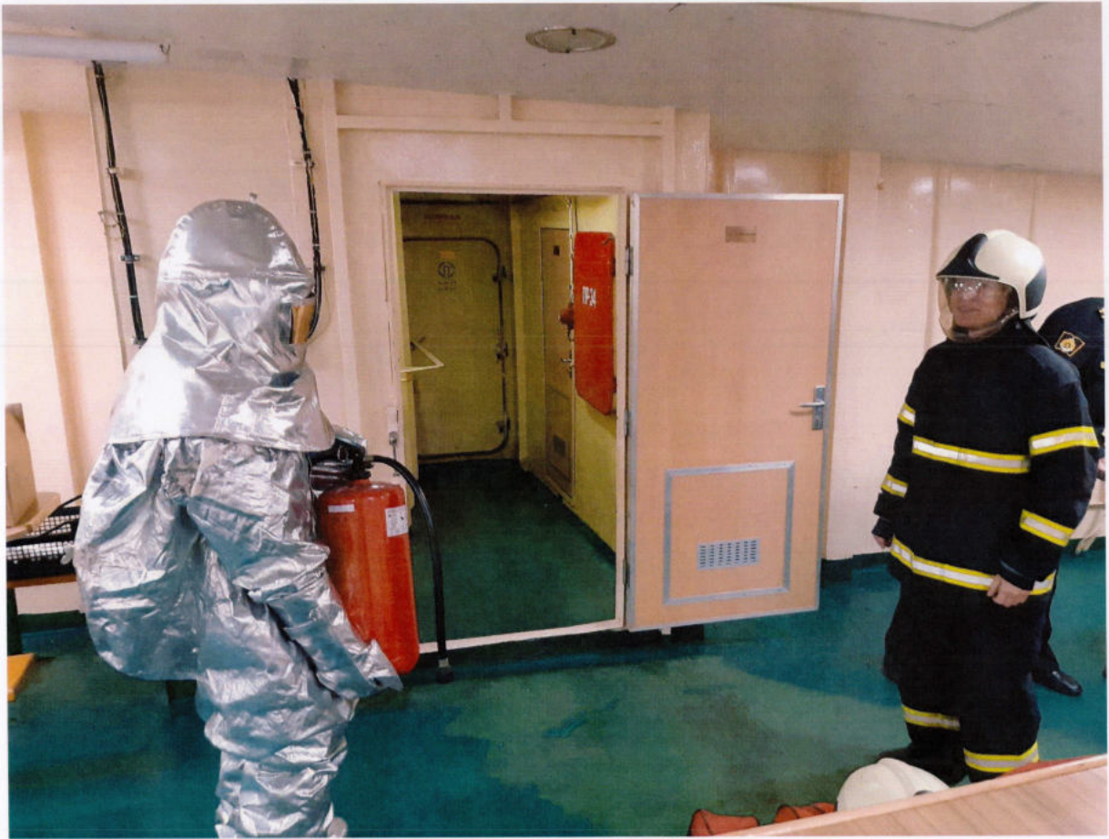
Учимся бороться за живучесть