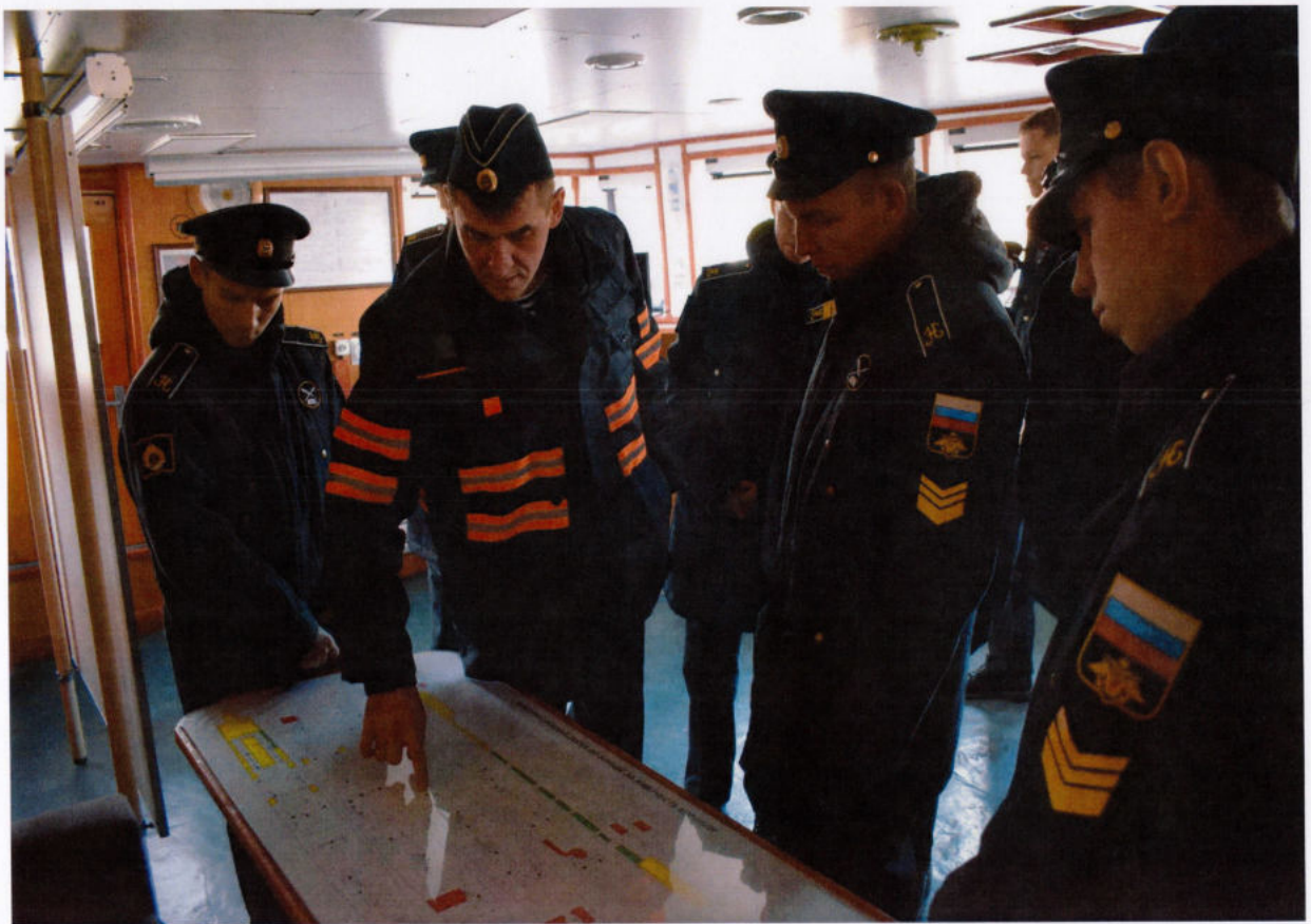
Идет занятие "Устройство корабля"